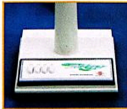
مدل ۳۰۱۰ دارای چراغ سیگنال