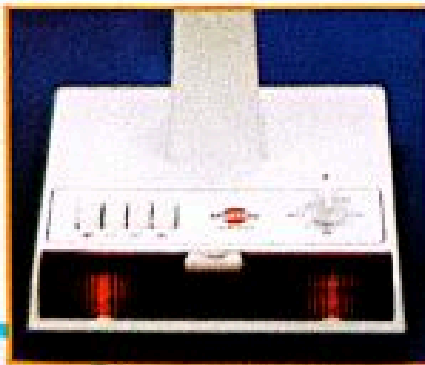
مدل ۲۰۳۰ پی دارای دگمه تنظیم زمان کار و چراغ خواب